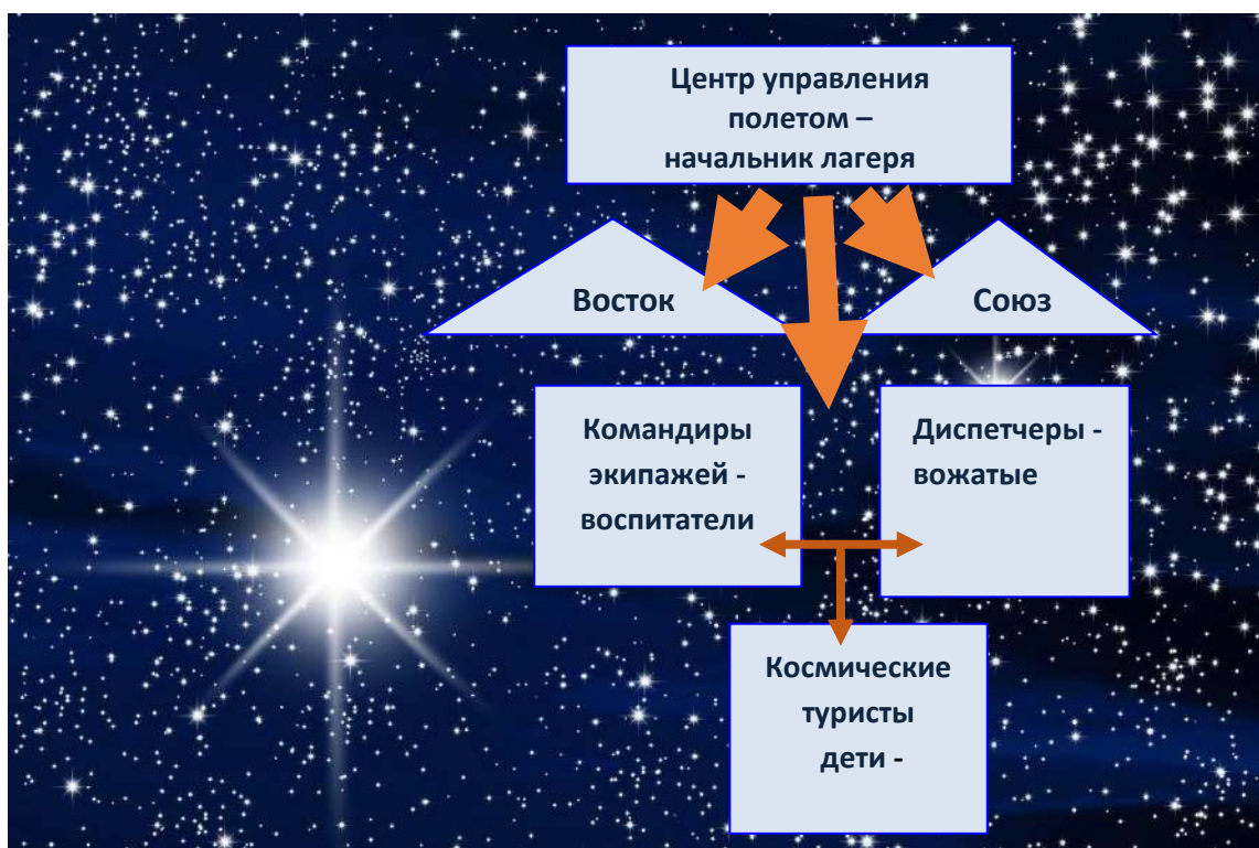
Схема управления «полетом»

Реализация целей и задач смены по программе «Путешествие по Галактике» осуществляется через организацию разноплановых тематических мероприятий и коллективно-творческих дел (Маршрут путешествия). Все учащиеся делятся на возрастные группы. Каждый отряд (экипаж) планирует свою работу с учётом общелагерного плана. Центром всего является неизвестная ранее галактика - Сириус